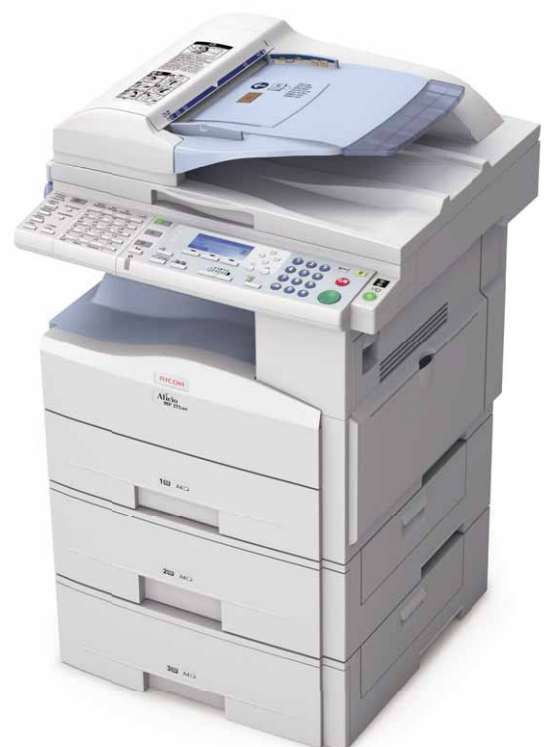
Aficio™ MP 171/MP 171SPF